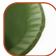
Struttura tubolare a doppia parete

™ indicates a trade mark of Fiberweb plc or a Fiberweb Group company, many of which are registered in a number of countries around the world.